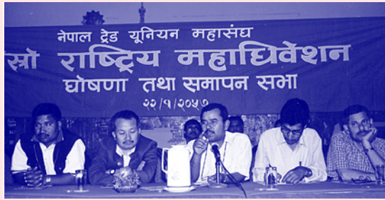
मिति : बैशाख २२ २०७७ स्थान: होटल ब्लुस्टार