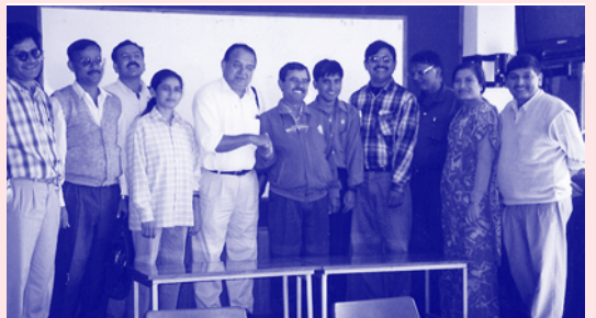
मिति: कार्तिक ६ ०७७ स्थान: मनमोहन मजदुर भवन

जिफन्ट केन्द्रीय कार्यालयमा तेस्रो चरणको वार्ता। एनटीयूसीबाट “राष्ट्रिय श्रम सभा” अवधारणा सहित विधान मस्यौदा प्रस्तुत। जिफन्टद्वारा “श्रम सिनेट” संचालनको सहमतिको आधार (कोड अफ अन्डरस्टान्डिङ) प्रस्तुत। दुवैतिरबाट व्यक्त धारणाको सारमा एक प्रकारको सामिप्यता रहेकोले ४/४ जना रहेको उच्च स्तरीय कार्यदल गठन।