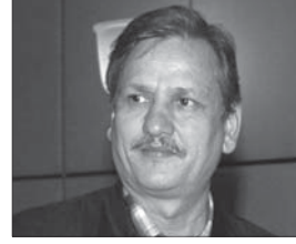
क. लेखराज भट्ट, श्रम तथा यातायात व्यवस्था मन्त्री Hon'ble Lekhraj Bhatta, Labour & Transport Mgmt. Minister