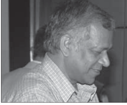
क. गणेश शाह, विज्ञान तथा प्रविधि मन्त्री Hon'ble Ganesh Shah, Minister for Science & Technology