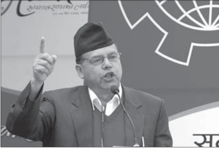
कार्यक्रम उद्घाटन र मन्तव्य : प्रमुख अतिथि क. भलनाथ खनाल, नेकपा (एमाले) Inauguration : Chief Guest J.N. Khanal, President - CPN (UML)

हामीहरू जो सहभागी भयौं / We who participated