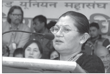
विशिष्ट अतिथि : क. अष्टलक्ष्मी शाक्य, उद्योग मन्त्री Special Guest : Com. Asta Laxmi Shakya, Minister of Industry