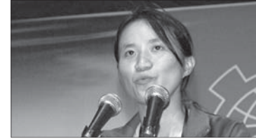
क. फिस आइपी, एचकेसीटीयू Ms. Fish IP, HKCTU