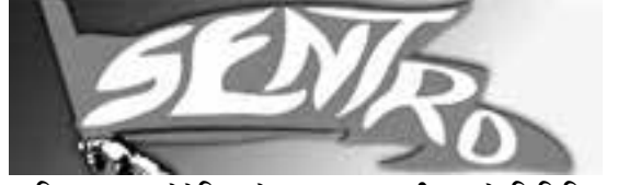
आलिएन्स अफ प्रोग्रेसिभ लेबर - एसइएनटीआरओ फिलिपिन्स Alliance of Progressive labour - SENTRO- Philippines