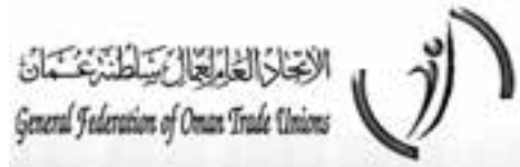
जनरल फेडरेसन अफ ओमान ट्रेड युनियन्स - जीएफओटीयु - ओमान General Federation of Oman Trade Unions GFOTU- Oman