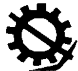
हिन्द मजदूर सभा, इन्डिया Hind Mazdoor Sabha, India